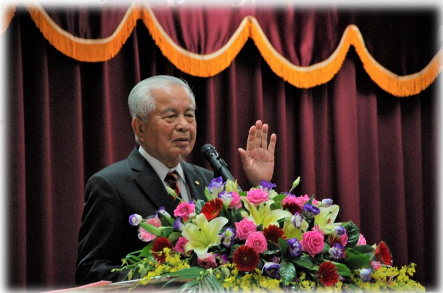
圖利與便民座談會