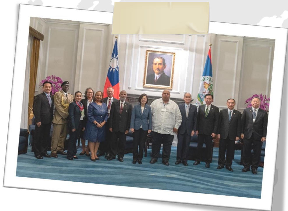
總統與貝里斯外賓合影