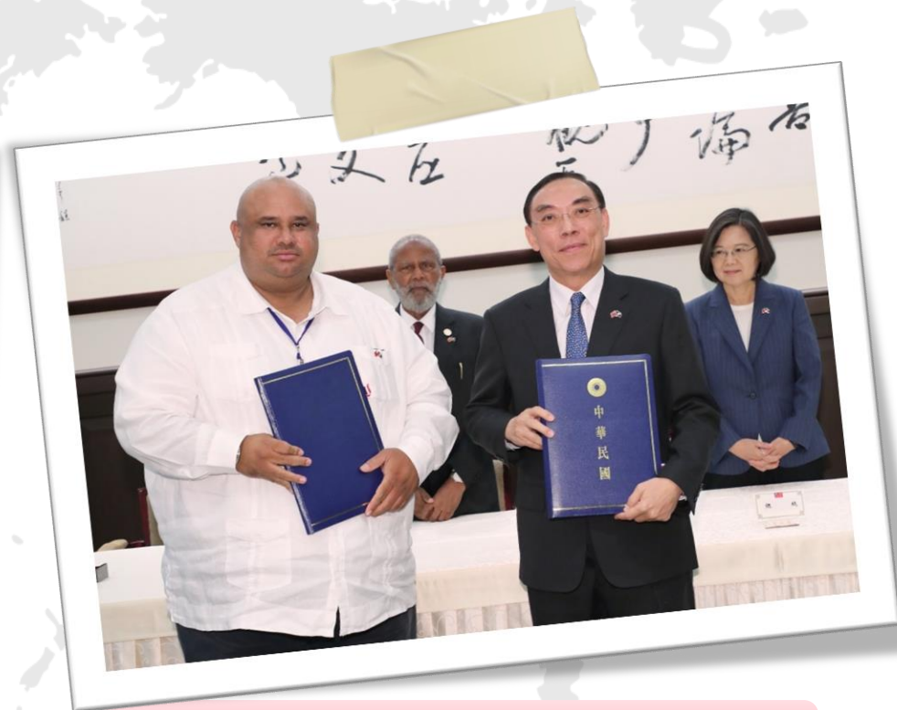
法務部長簽署廉政合作協定