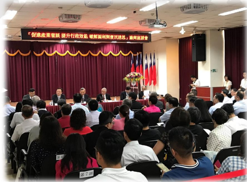
圖利與便民座談會