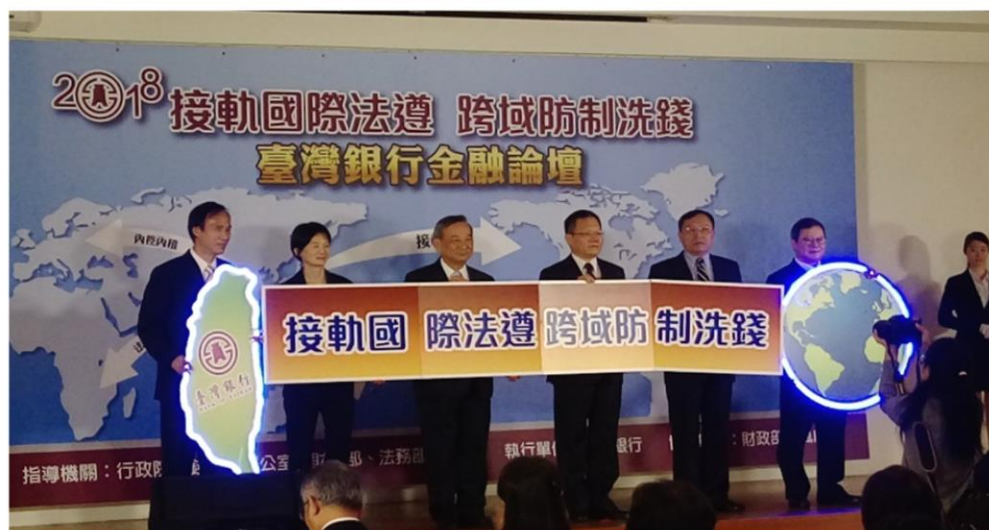
企業誠信宣言座談